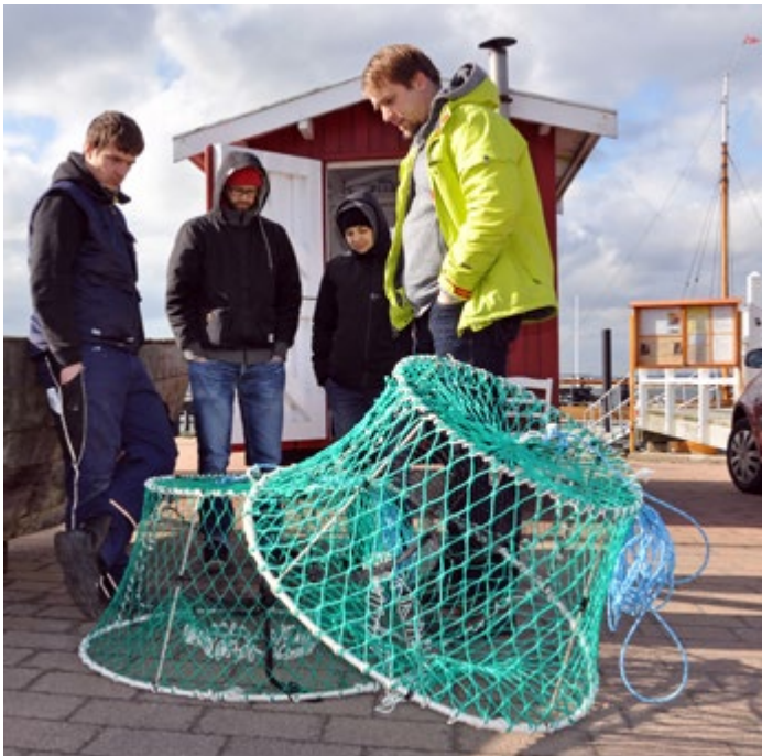
Wissenschaftliche Begutachtung der Fischfallen durch das Thünen-Institut am Museumshafen Probstei

wirtschaftliche Direktvermarktung, sowie die Küstenkultur fördern und unterstützt damit auch zentrale Ansätze der (Fisheries Local Action Group) FLAG Ostseeküste. Im vorliegenden Gemeinschaftsprojekt sollen Fischfallen auf ihre Funktionalität und Fängigkeit in der schleswig-holsteinischen Ostseefischerei untersucht werden. Dazu werden bis zu 30 Fallen angeschafft und vor der Probsteiküste stationär ausgebracht. Die beteiligten Fischer konzipierten diese Fischfallen selbst und werden in großer Eigenverantwortung das Projekt durchführen und dabei von den Partnern aktiv unterstützt. Es geht dabei vorrangig um die Weiterentwicklung einer innovativen Fischfalle in der fischereilichen Praxis. Wir freuen uns, dass wir neben den Projektpartnern: Den Fischereibetrieben Rönna und Meyer, dem Thünen-Institut für das wissenschaftliche Monitoring und den Gemeinden Schönberg, Stein und Wendtorf das innovative Gemeinschaftsprojekt bezüglich der Küstenkultur begleiten.