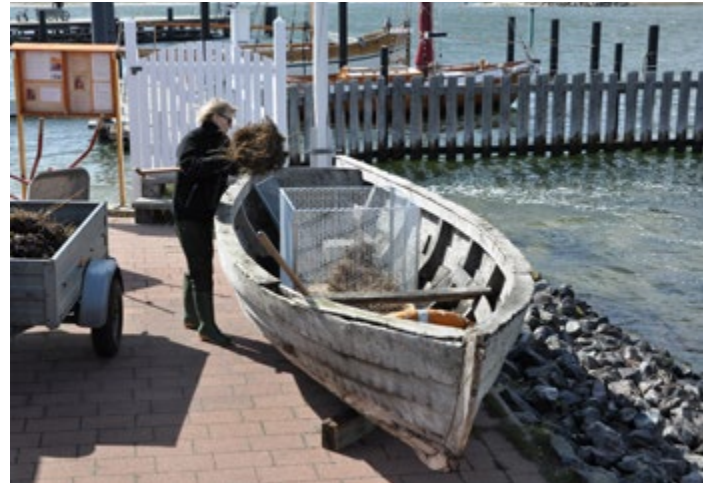
POSIMA-Treibsel und Kartoffeln im Pram

am Museumshafen Probstei, befüllten ihn mit Treibsel und pflanzten neun Kartoffeln der Sorte Princess, so die Vorgabe des Wettbewerbs.