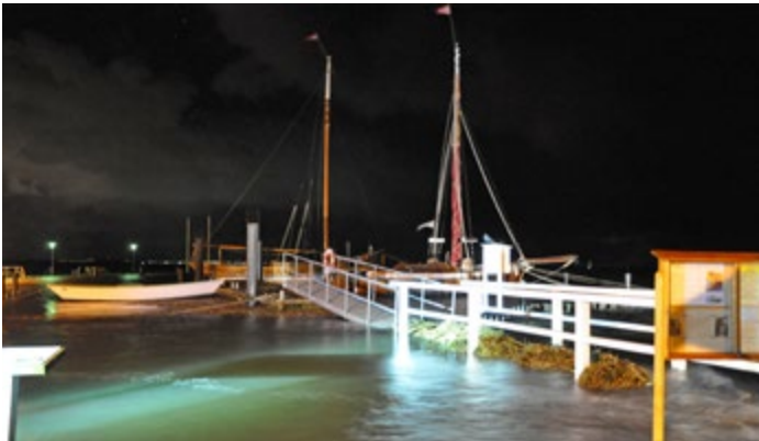
Januarhochwasser 2017 am Museumshafen

Gleich zu Beginn des Jahres 2017 fegte das Sturmtief AXEL von Norwegen über Dänemark nach Polen. Der Sturm trieb dabei das Nordseewasser durch das Skagerrak und Kattegat in die Ostsee. Mit den gut dimensionierten „Heckpfählen“ und dem Schwimmsteg war der Museumshafen Probstei gegen das Unwetter gut gewappnet und hatte zudem Schutz durch Bottsand. Die Promenade und der Zugang zum Museumshafen waren in der Nacht vom Hochwasser kurz überschwemmt, zurück blieb am Spülsaum lediglich Treibsel. Das Hochwasser mit einem Pegelstand von ungefähr 1,7 m üNN hinterließ im Hafen keine Schäden. Andernorts an freiliegenden Steilküsten und Stränden wurden dagegen erhebliche Schäden gemeldet.