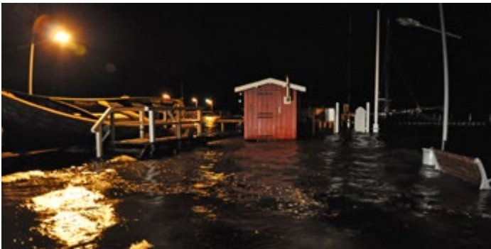
Überspülte Promenade zum Januarhochwasser 2017