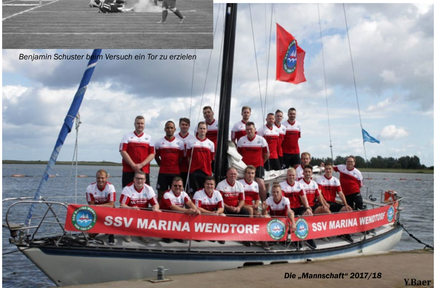
Die „Mannschaft“ 2017/18